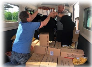
Der Gemeindebus wird beladen