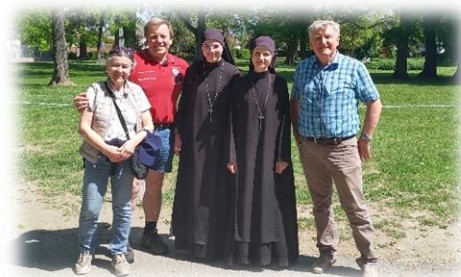
Die Übergabe der Hilfsgüter ist erfolgt

Also wurden wieder haltbare Lebensmittel gekauft und eingelagert. Mit erneuter Unterstützung der St. Georg-Apotheke wurden Medikamente bestellt und verpackt.