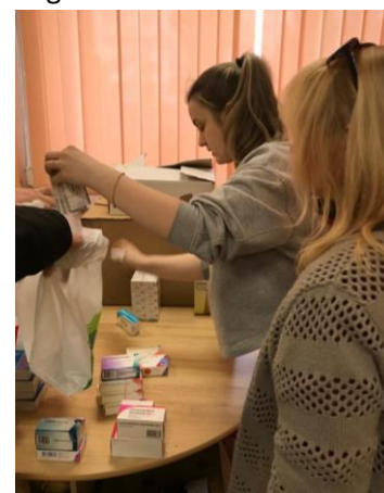
Medikamentenausgabe im Flüchtlingslager

Am 16. Mai war es dann so weit. Wir waren mit zwei Ordensschwestern in Beregsurány verabredet, einem kleinen Grenzort am südlichen Rand der Karpaten. Rasch wurden die Hilfsgüter umgeladen. Nachdem das weitere Vorgehen besprochen war, machten sich die Schwestern schon wieder auf den Weg über die Grenze in die Ukraine.