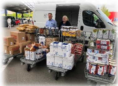
Der Einkauf ist erledigt